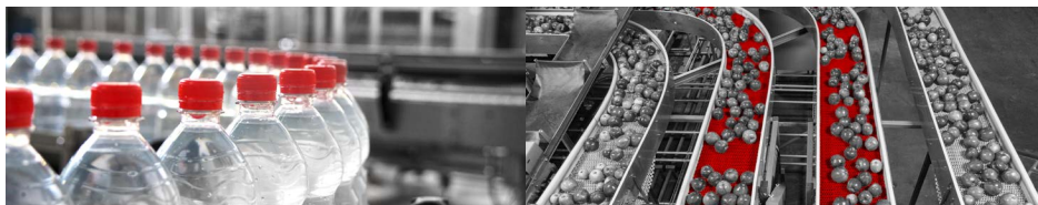
Alimentos y bebidas