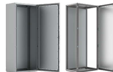
EKSS / MCSS-HP