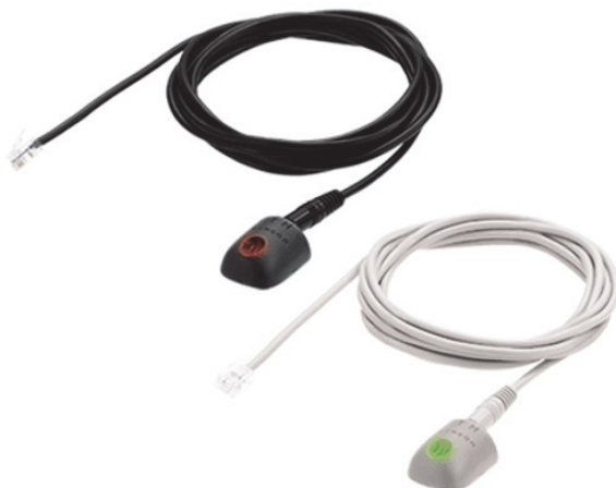
Temperatursensor und Kombisensor (Temperatur und Feuchte)