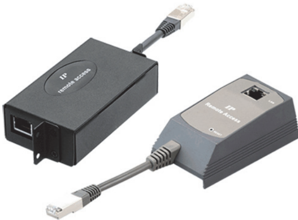
IP Gateway (Horizontale/19" Montage und vertikale Montage)