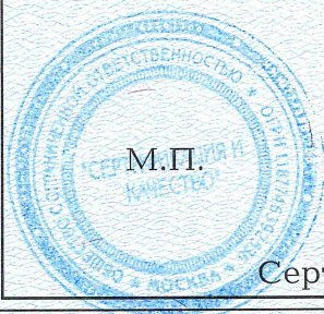
Схема сертификации: 1с.