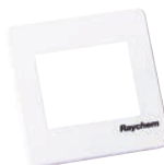
WHITEFRONT RAL 9010