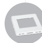
Extra-Frontblende RAL 9003