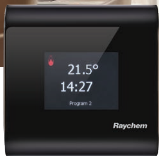
Schwarzes nVent RAYCHEM-Design