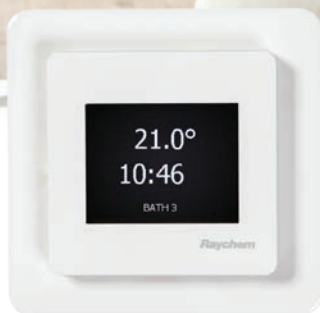
WHITEFRAME RAL 9003